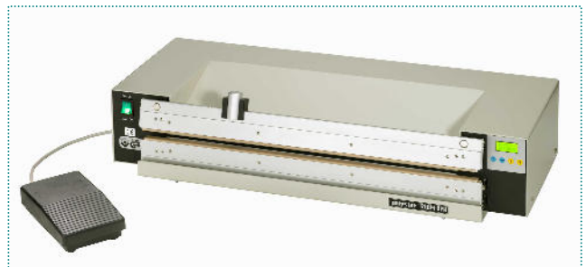
618 M-RPA mit Schneidvorrichtung

www.polystar-hamburg.de eMail: info@polystar-hamburg.de