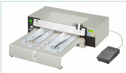
418 M-RPA mit SV und Anstecktisch