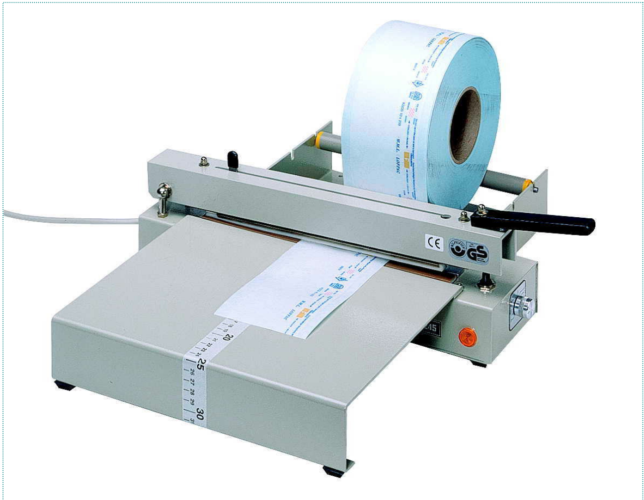
„polystar®“ 245 mit Schneidvorrichtung, Anstecktisch und Folienabroller