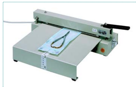
„polystar®“ 244 mit Anstecktisch

www.polystar-hamburg.de eMail: info@polystar-hamburg.de