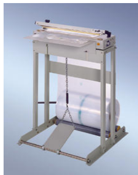
420 FSV mit Tischgestell