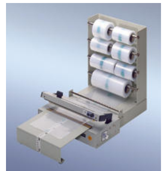
230 FSV m. Magazin + AT

www.polystar-hamburg.de eMail: info@polystar-hamburg.de