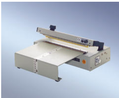
230 FSV mit Anstecktisch