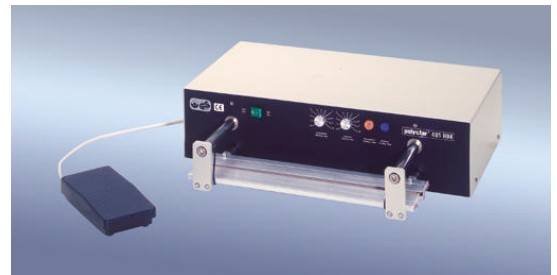
polystar® 401 HM