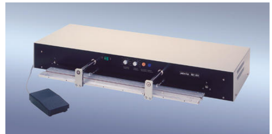
polystar® 801 HM