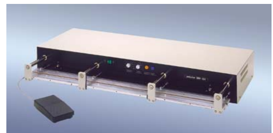
„polystar®“ 1001 HM

www.polystar-hamburg.de eMail: info@polystar-hamburg.de