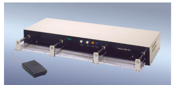
polystar® 1001 HM

www.polystar-hamburg.de eMail: info@polystar-hamburg.de