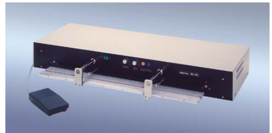
„polystar®“ 801 HM