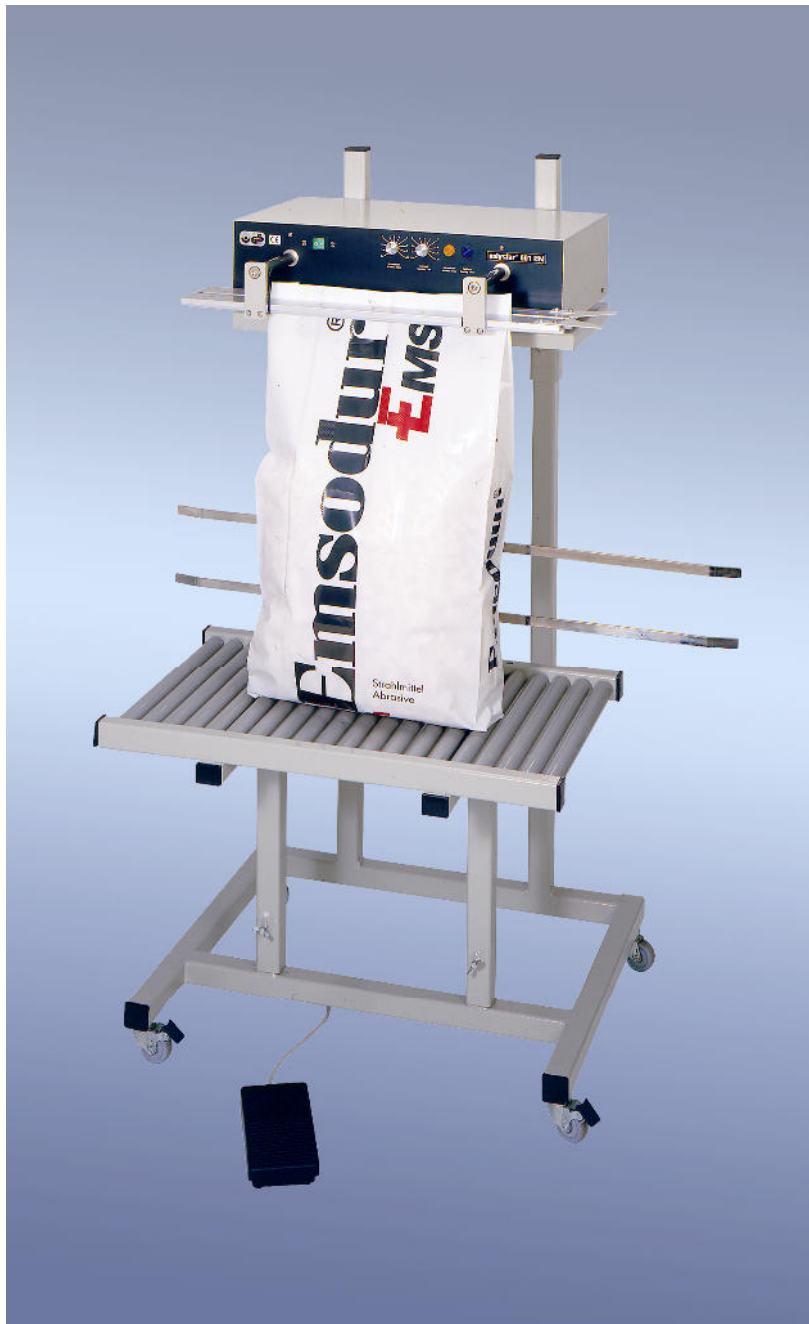
polystar® 601 HM mit Hubwagen