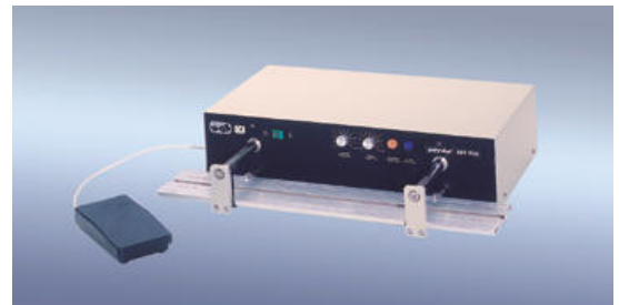
polystar® 601 HM