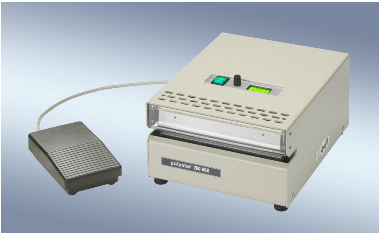
polystar ® 260 HSG mit Fußdrucktaster