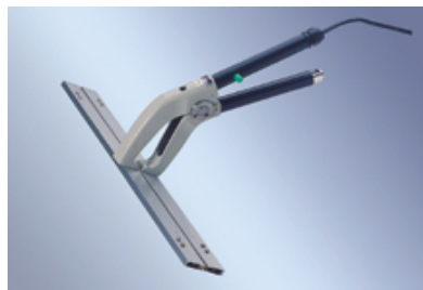
SFZ - Zangen 300 + 400