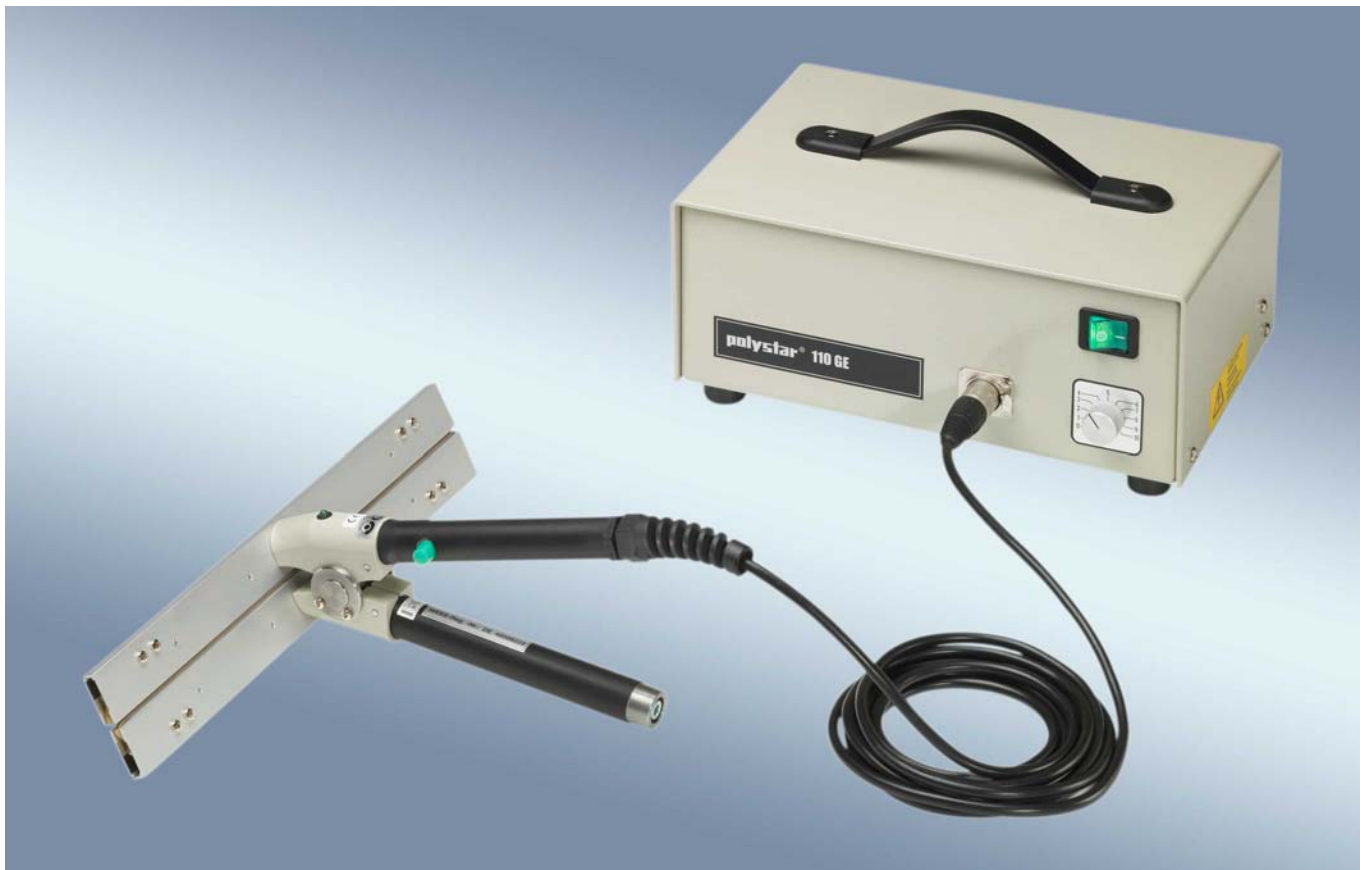
Impulsgeber 110 GE mit Standard-Schweißzange 300 D